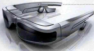
CARL ZEISS/CINEMIZER SILVER

Occhiale-visore per iPod/Dvd con altoparlante integrato, schermo virtuale di 44" e regolazione separata delle diottrie. 373 euro. www.bow.it